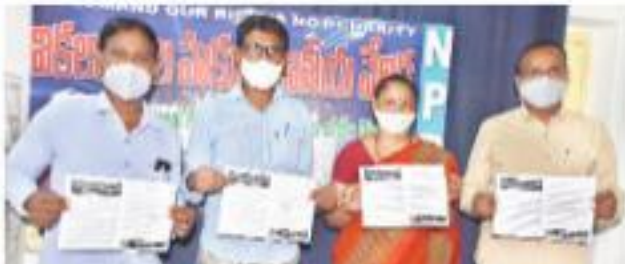
12,75,444 మంది, వితంతువులు 14,49,512 మంది, వికలాంగులు 4,97,819 మంది పింఛన్ను పొందుతున్నారని వివరించారు. 2018, అక్టోబర్ నుంచి కొత్త పింఛన్ కోసం వృద్ధులు, వితంతువులు ప్రభుత్వ కార్యాలయాలలో దరఖాస్తు చేసుకున్నారని తెలిపారు.

పిండింగ్లో ఉన్న వృద్ధులు, వితంతువులు, వికలాంగులు పింఛన్ను విడుదల చేయాలి 6న రాష్ట్రవ్యాప్తంగా కలెక్టరేట్ల వద్ద ధర్నాలు : ఎన్సీఆర్టీ పిలుపు